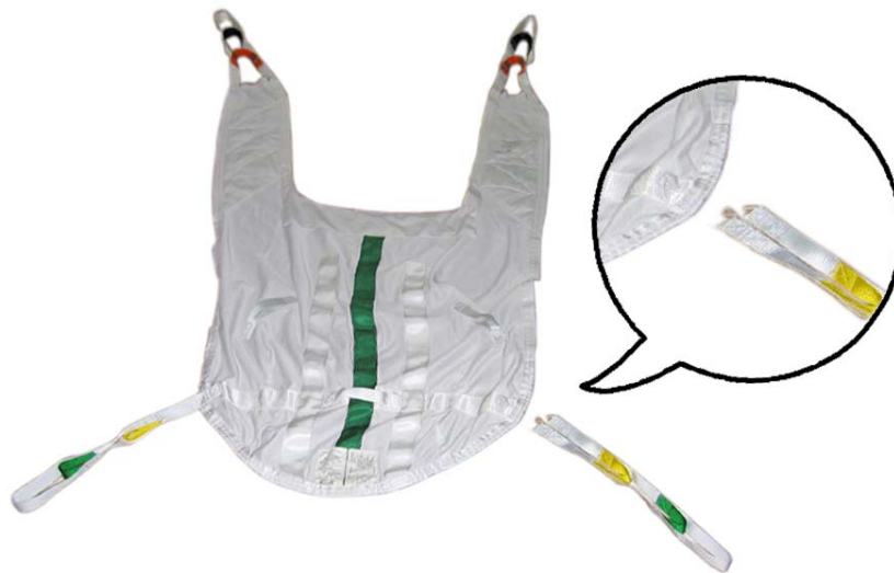
Figure 1 : Défaillance prématurée de la couture

Ce bulletin se rapporte à la défaillance prématurée de la couture située à la jonction d'une courroie du niveau des épaules à la partie principale de la toile. Cette défaillance peut être détectée lors d'une inspection de routine et n'est pas soudaine, mais graduelle. Il est donc hautement improbable qu'une toile ayant été soigneusement inspectée avant l'exécution d'un transfert, et considérée comme adéquate pour l'utilisation, puisse s'avérer faire défaut pendant un transfert.