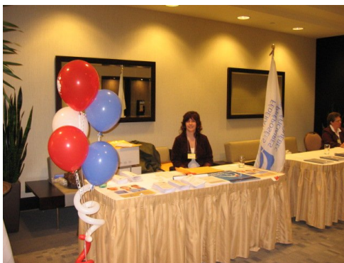
Nous étions prêt à accueillir les professeur(e)s en Santé.

Le 07, 08, 09 mai 2008 dernier avait lieu le Congrès 2008. Le thème étant : « Olympiques et multiculturalisme. ». Le congrès soulignait les nouvelles réalités culturelles et ethniques qui sont marquée dans les centres de formation professionnelle. Le congrès se tenait au Hyatt Regency à Montréal. La Fédération a été invitée, le 09 mai 2008, pour exposer ses services et documents afin que les professeur(e)s en santé puisse échanger avec la direction générale de la Fédération.