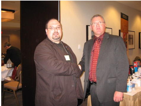
Discussion entre le d.g. de la F.P.B.Q. et le d.g. des comptes corporatifs de la l'entreprise Paramédic, équipements et fournitures dans les soins santé.