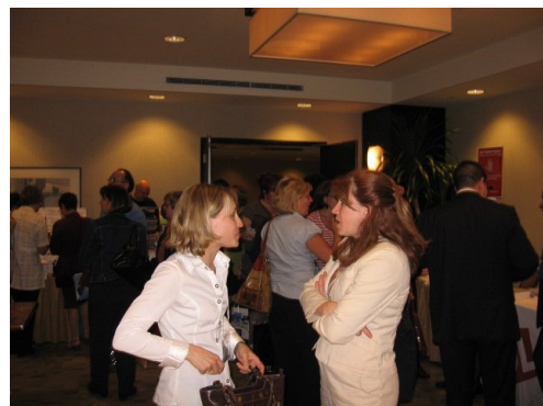
Il y a eu un nombre convaincant de participant(e)s au congrès.