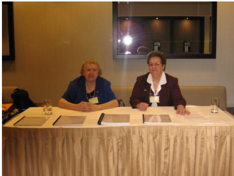
Nos collègues, l'association des auxiliaires familiales et sociales du Québec qui étaient présent.