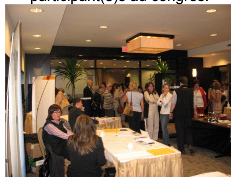
Plusieurs exposant(e)s, pour interpeller les professeur(e)s en Santé.