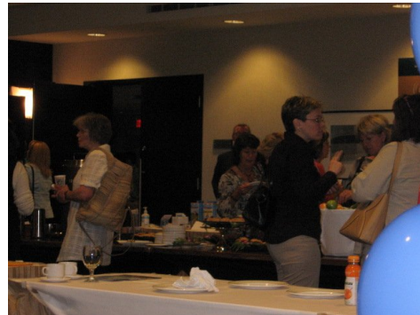
Durant une pause entre deux ateliers !

Nous voudrions remercier l'AQPS et de leurs exécutifs, pour l'accueil chaleureux et courtois, les professeur(e)s en santé ont pu constater l'existence de la Fédération.